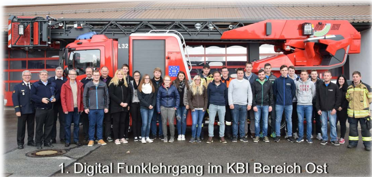
1. Digital Funklehrgang im KBI Bereich Ost