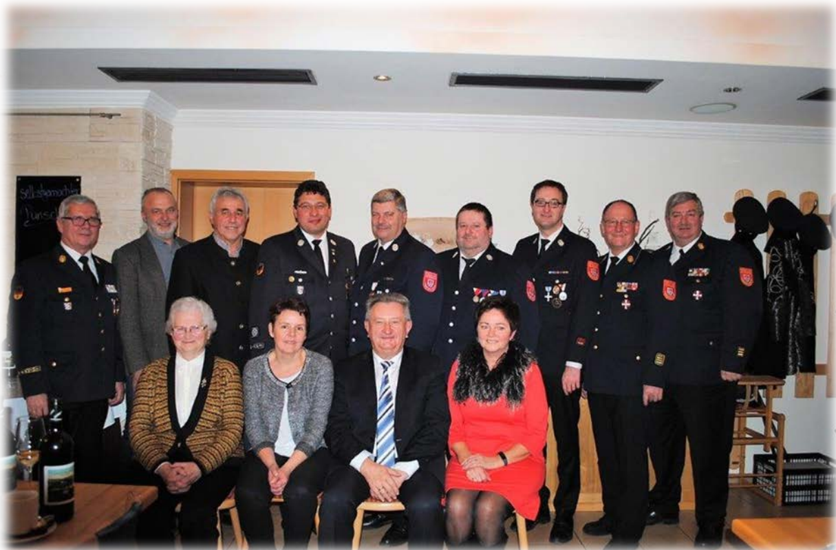
Kameradschaftstreffen in Breitenberg