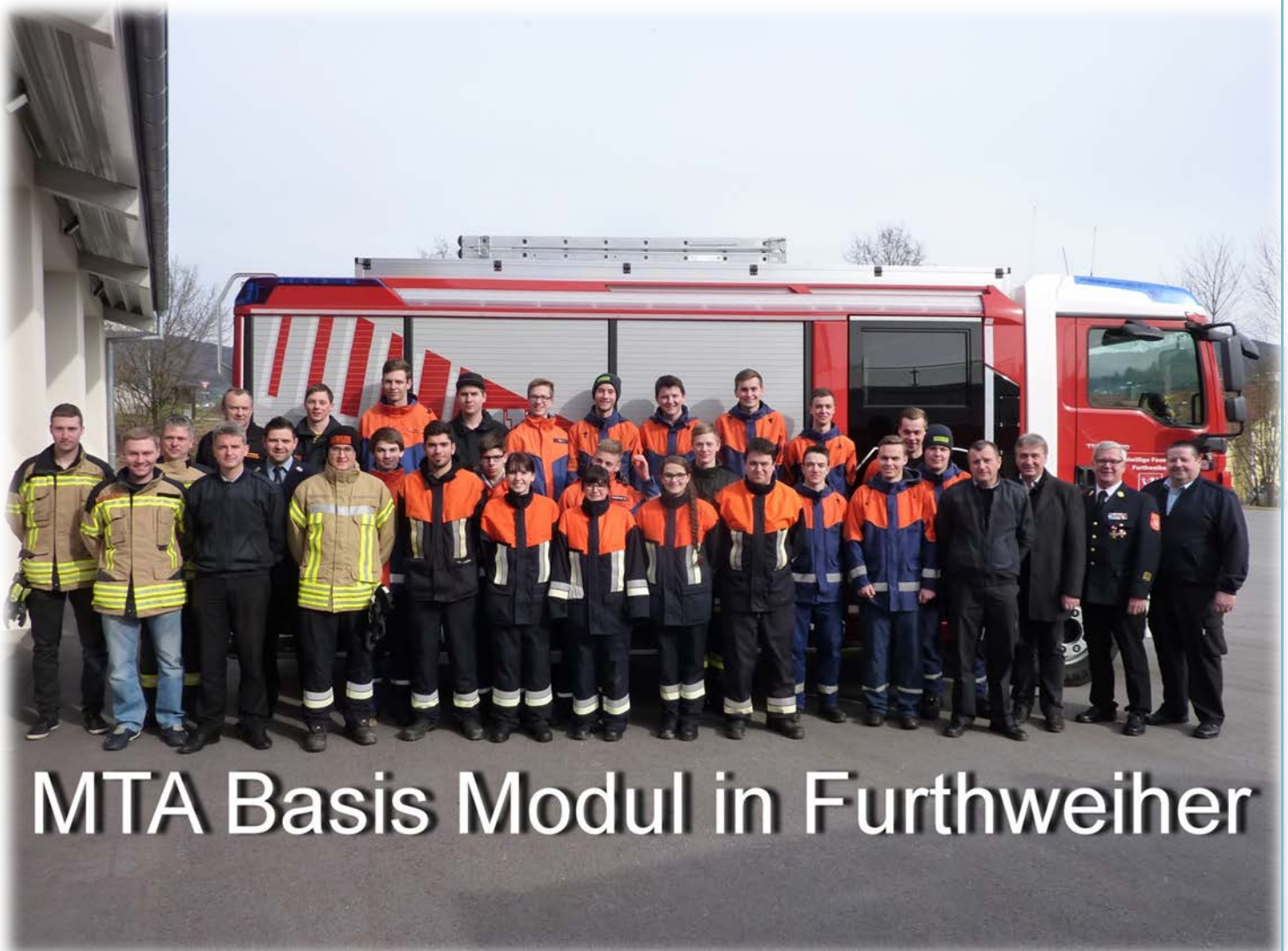
MTA Basis Modul in Furthweiher