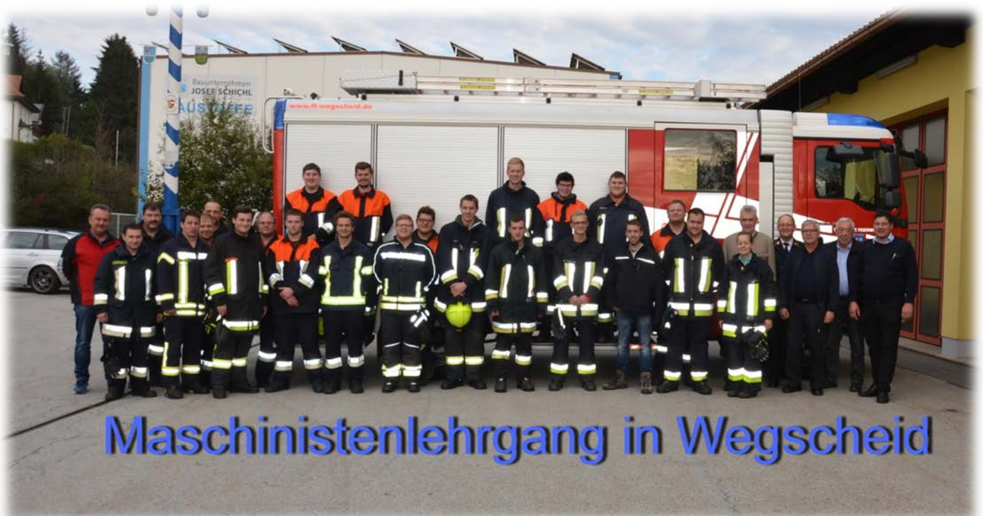
Maschinistenlehrgang in Wegscheid