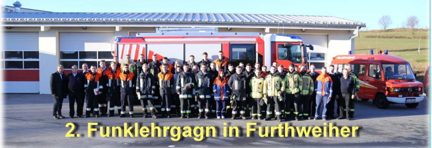
2. Funklehrgagn in Furthweiher