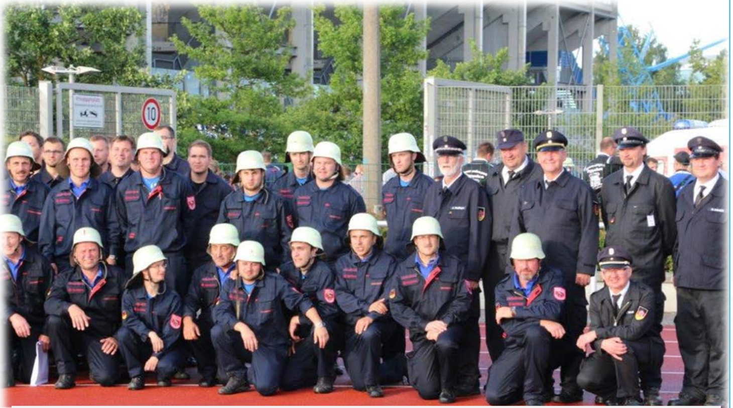
Die zwei Bewerbungsgruppen aus Breitenberg mit den Bayerischen Bewertern.