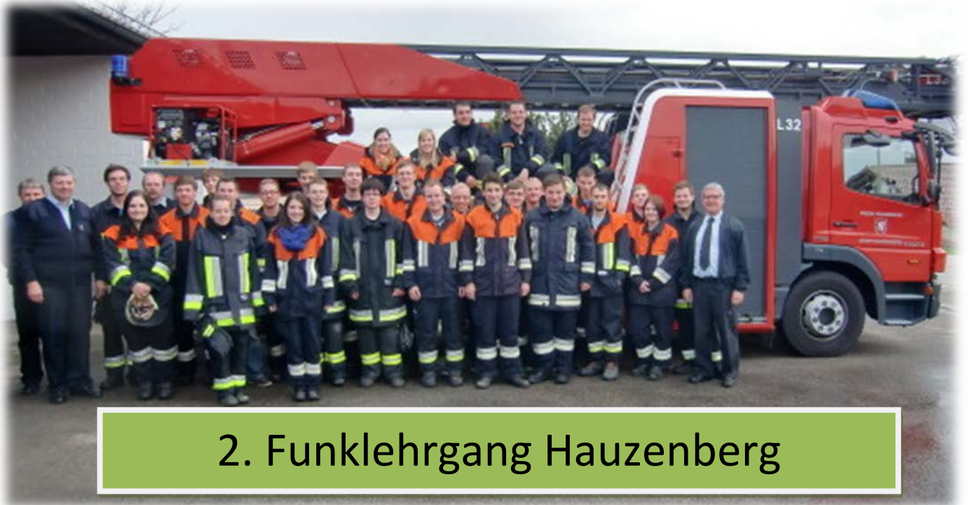
2. Funklehrgang Hauzenberg