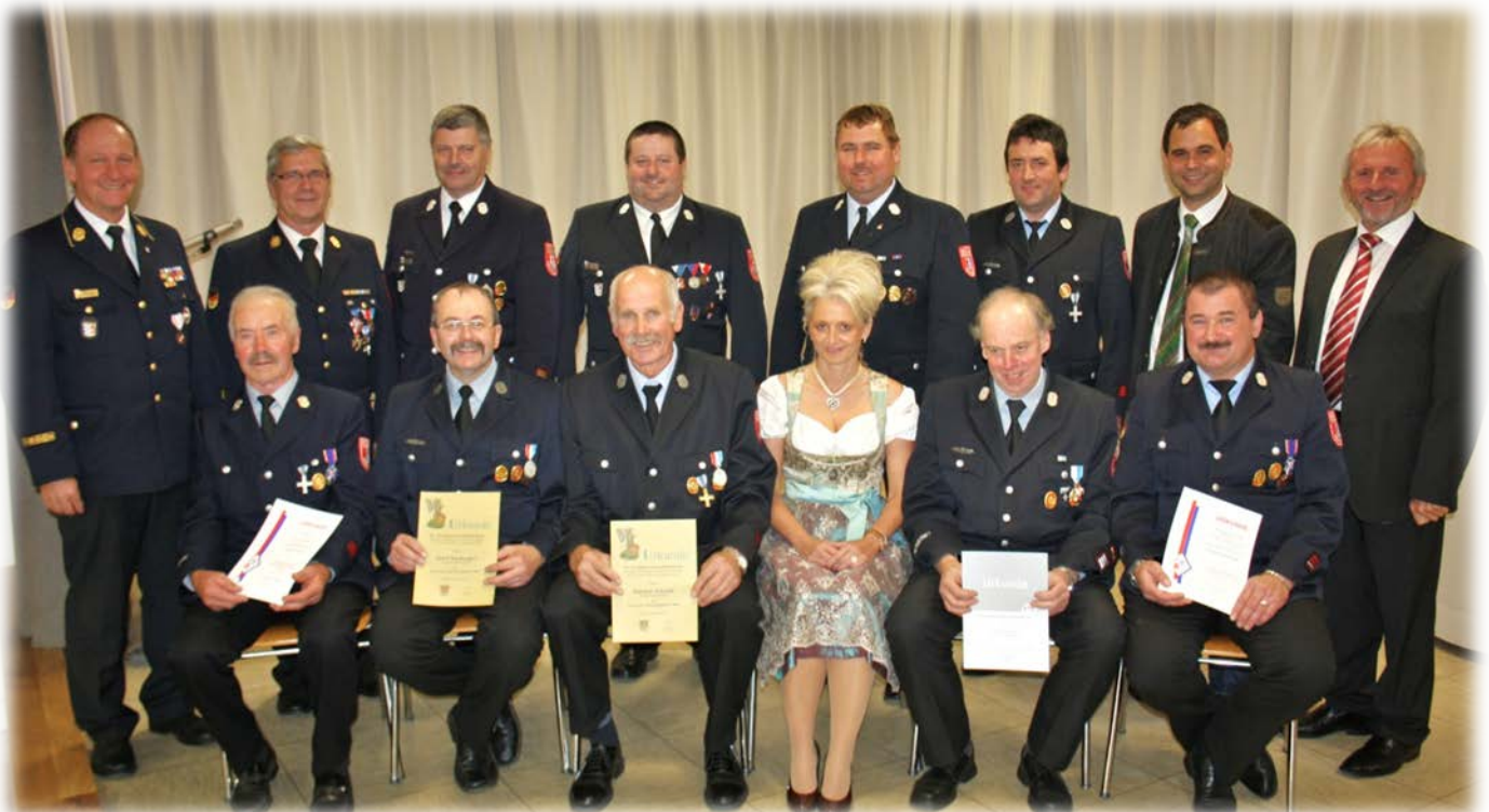
Verbandsehrungen bei der FF Büchlberg