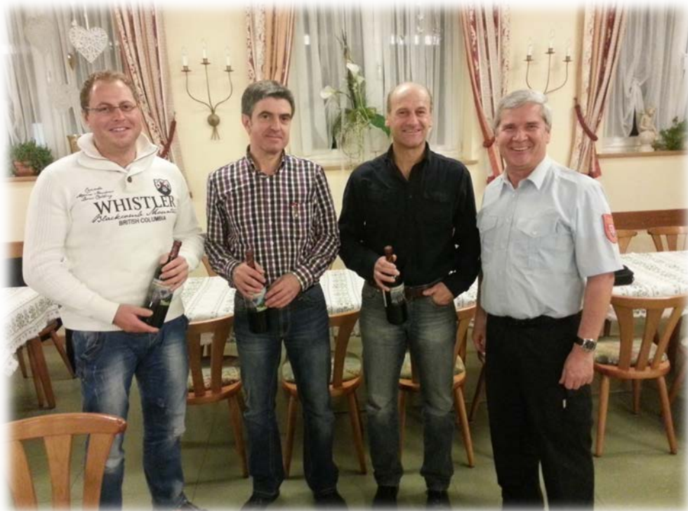
Infoabend mit der Polizei