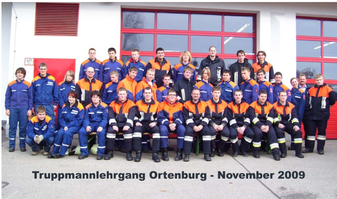
Truppmannlehrgang Ortenburg - November 2009

Bei den Verschiedenen Standortlehrgängen gilt der Dank an die jeweils ausrichtende Feuerwehr, mit ihren zahlreichen Helfern