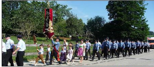
Beim Kirchenzug bildeten die Mitglieder der Freiwilligen Feuerwehr Thanham den Schluss.