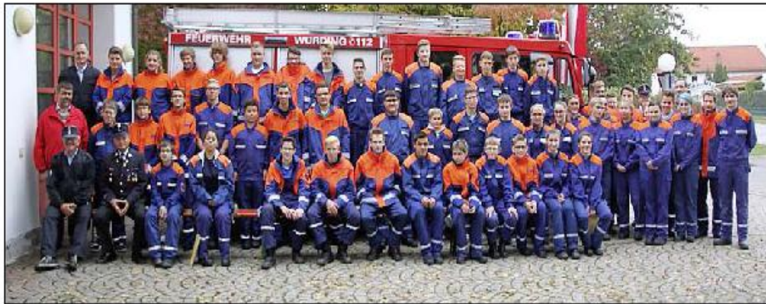
Die Jugendfeuerwehranwärter haben den Wissenstest, der heuer in Würding stattfand, mit Bravour gemeistert.