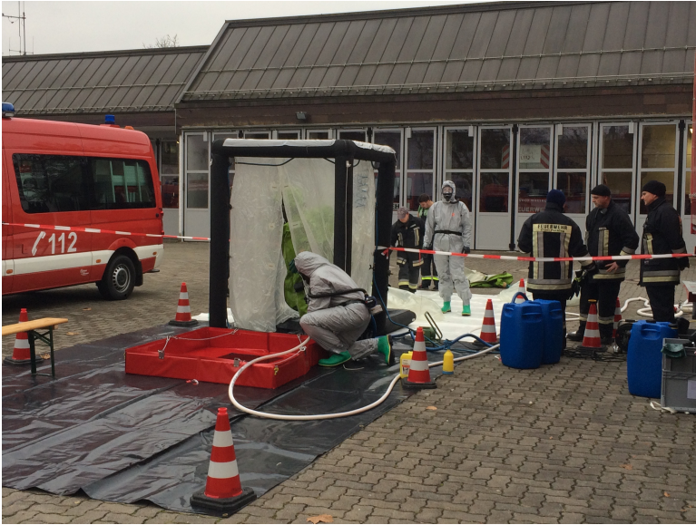
Dekoneinheit der FF Pocking