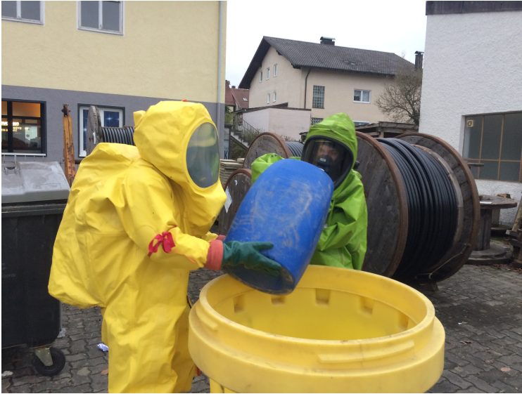
Beschädigte Behälter in einem Überfass zwischenlagern