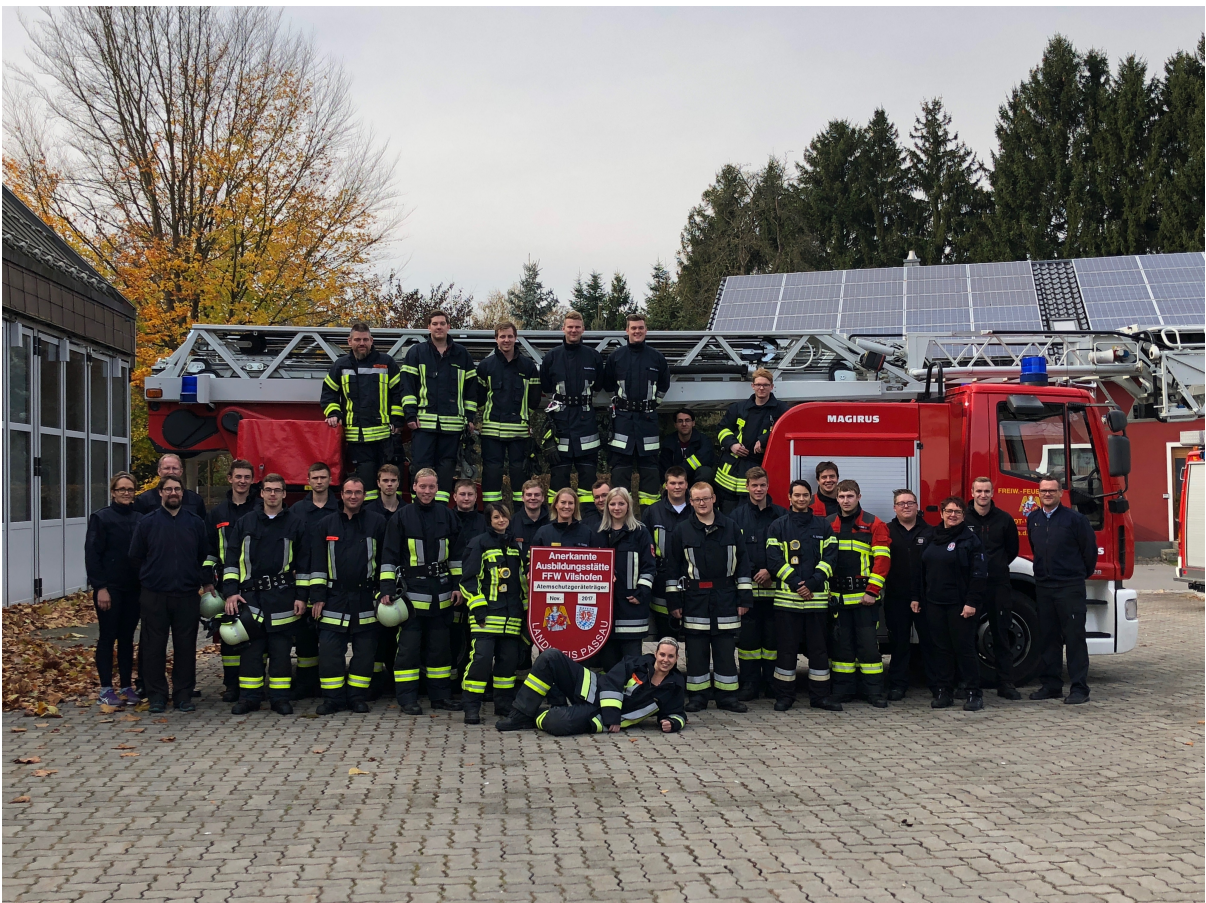
Teilnehmerfoto 164. AGT Lehrgang