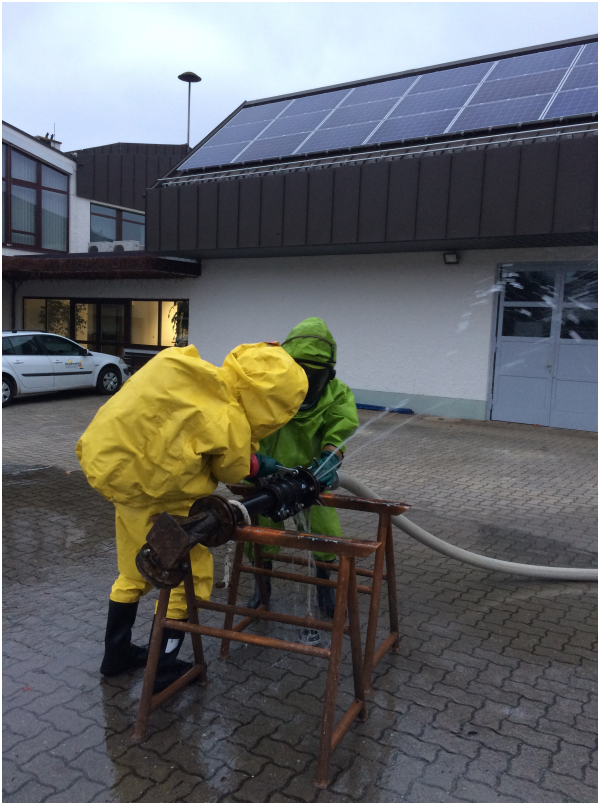
Abdichten eines beschädigten Säurerohres