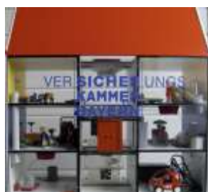
Rauchhaus vom LFV