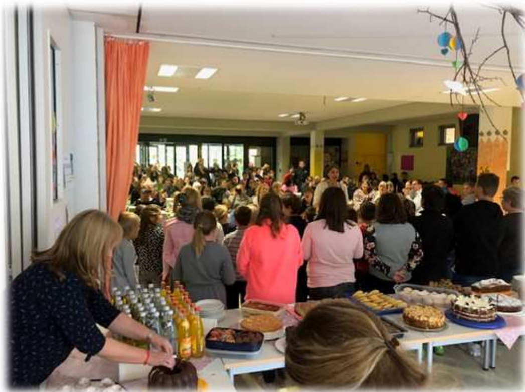
Foyer der Förderschule –Empfang und Begrüßung der Gäste und Eltern