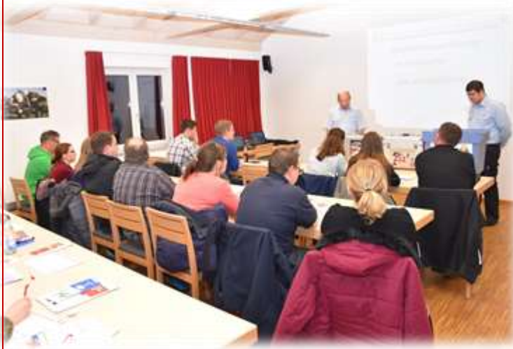
Begrüßung und Einführung