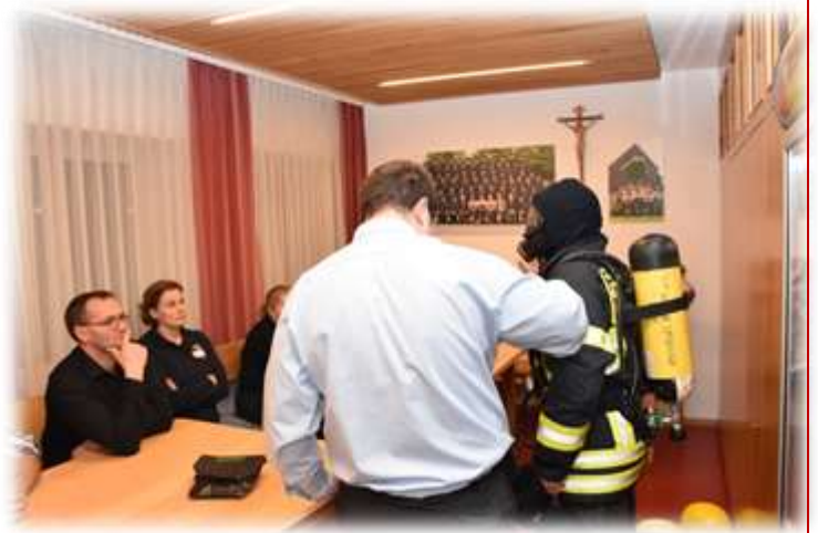
Anlegen der Schutzausrüstung

Praxis: Kind gerechtes erklären der Ausrüstung und Fahrzeuge